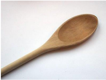
CUCCHIAIO DI LEGNO